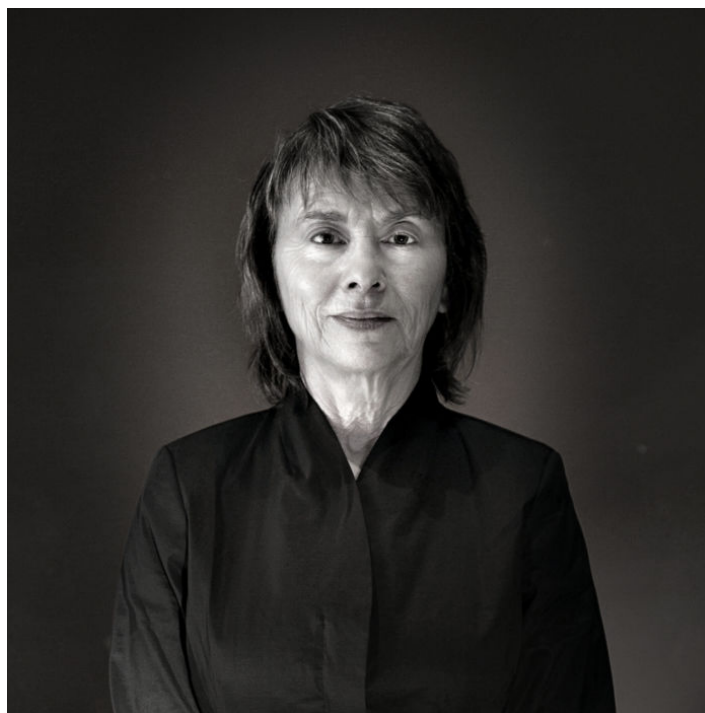
Camille Paglia.

71-årige Paglia, der er aktuell med endnu en samling tekster om køn, kultur, politik og religion, ville nok ikke have følt sig hjemme på Forfatterskolen, som den så ud omkring starten og midten af 1990'erne, da der ifølge flere kilder ikke ligefrem var vandtætte skotter mellem privatliv og skoletid. Hun er heller ikke begejstret for de flydende omgangsformer mellem underviser og studerende, som tidligere på året førte til en usædvanlig MeToo-sag i Paglias egen akademiske verden. En ældre kvindelig professor ved New York University blev suspenderet i et år uden løn for at have sexchikaneret en yngre mandlig kandidatstuderende. Hun sendte ham indsmigrende e-mails, overnattede i hans lejlighed og syntes i det hele taget at kræve en loyalitet og intimitet, der gik langt ud over deres professionelle forhold.